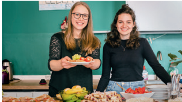
Das Team von Alabaster Jar ist im Berliner Rotlichtviertel unterwegs, um mit kleinen Gesten der Wertschätzung und im Café-Einsatz vertrauensvolle Beziehungen mit den Betroffenen aufzubauen.